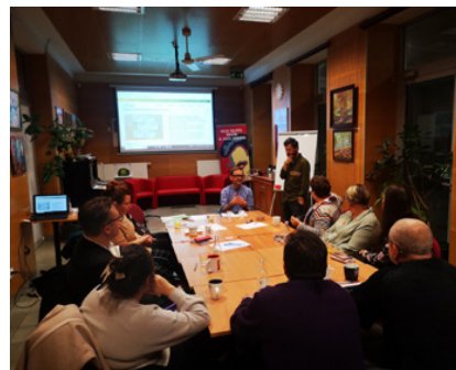
fol: fb.com/Zielone Kujawy

W ramach dotychczasowych działań projektowych odbył się spacer mający na celu zlokalizowanie drzew, które zasługują na objęcie ochroną pomnikową. Odbyło się spotkanie z Burmistrzem i urzędnikami, gdzie omówiono założenia projektu oraz pierwsze spotkanie zespołu roboczego, na którym przeanalizowane zostały obszary,