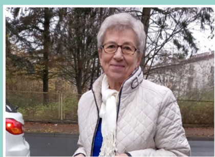
fol: Stowarzyszenie Szmaragdowy Paw

W ramach "Żywnościowego SOS 2" kupiono nie tylko żywność, ale również podstawowe artykuły gospodarcze i higieniczne, tak ważne w codziennym funkcjonowaniu. Następnie, wolontariusze i członkowie przygotowali i przekazali starannie przygotowane paczki. W ten sposób Stowarzyszenie niesioną pomocą uczyniło codzienność seniorów łatwiejszą i bardziej komfortową.